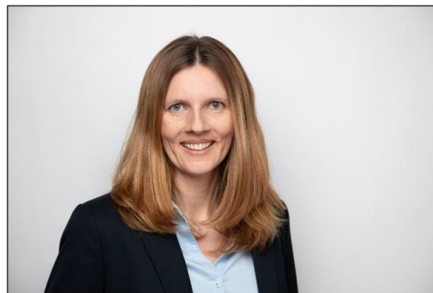
Image 2

Grâce à la générosité de nombreux donateurs, un capital de fondation de CHF 67'000 a pu être réuni, permettant la constitution officielle de la fondation en avril 2022.